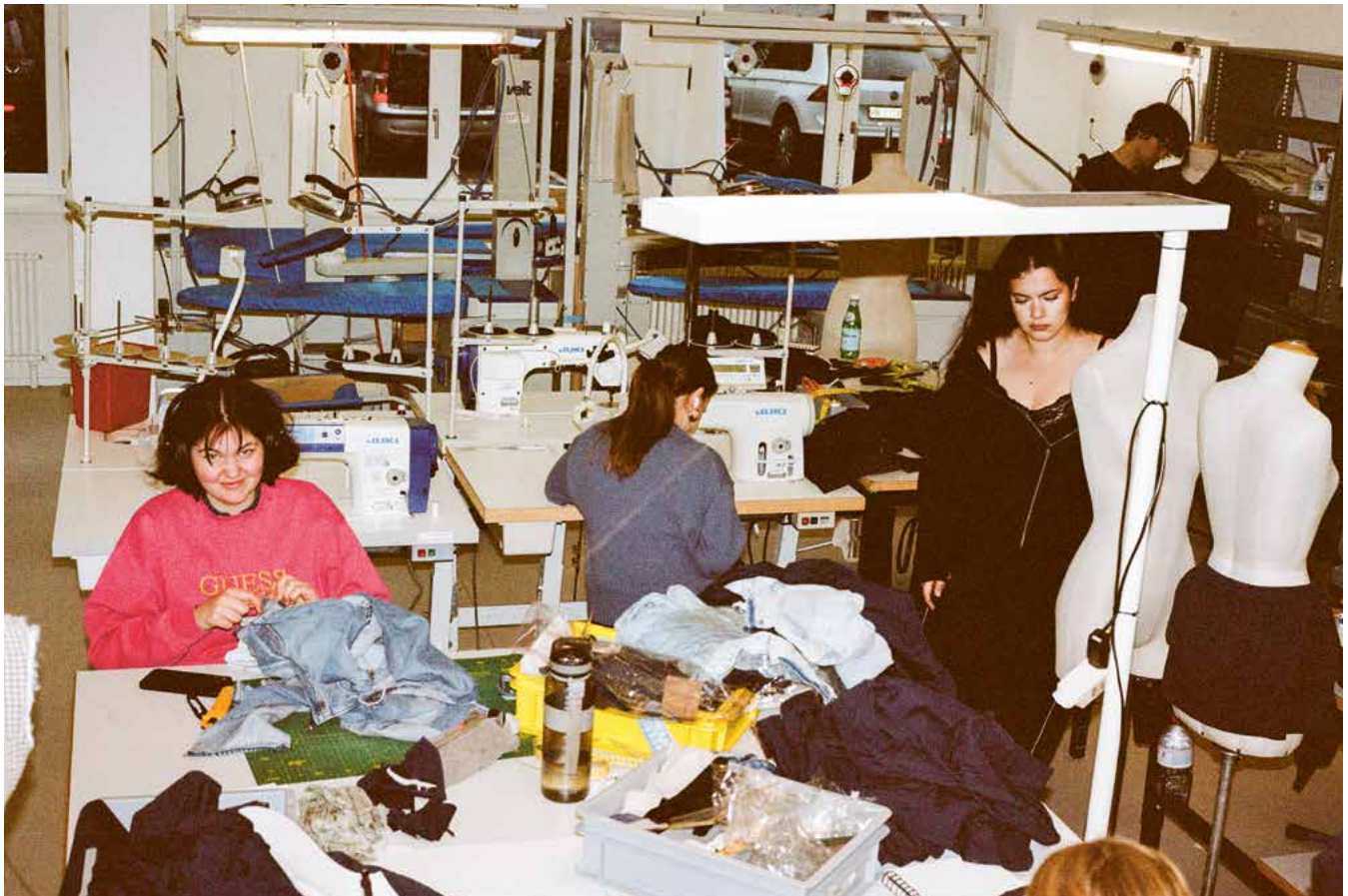
Atelier organisé par le NCCFN, IDM Thun.